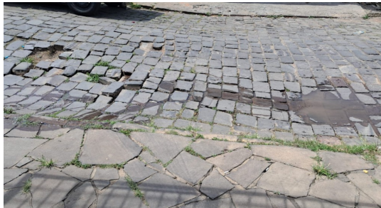
Rua Liborio Dall'Agnese bairro Zatt

https://maps.app.goo.gl/2KnvgnTRqus3ix8x7