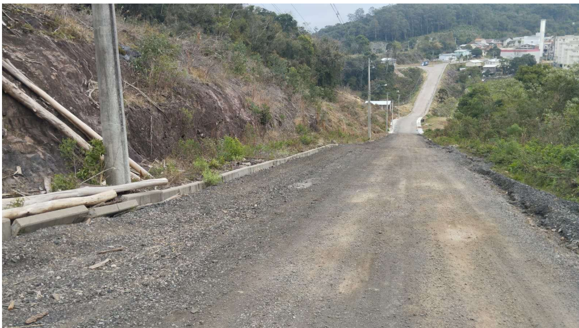
Rua Mário Luiz Massuti, próximo ao Condomínio Bandeira.