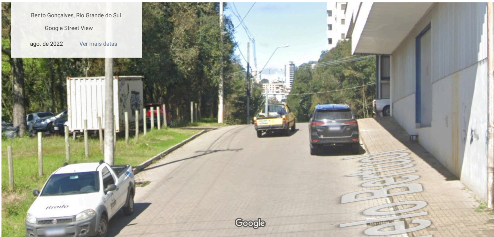
Captura da imagem: ago. de 2022