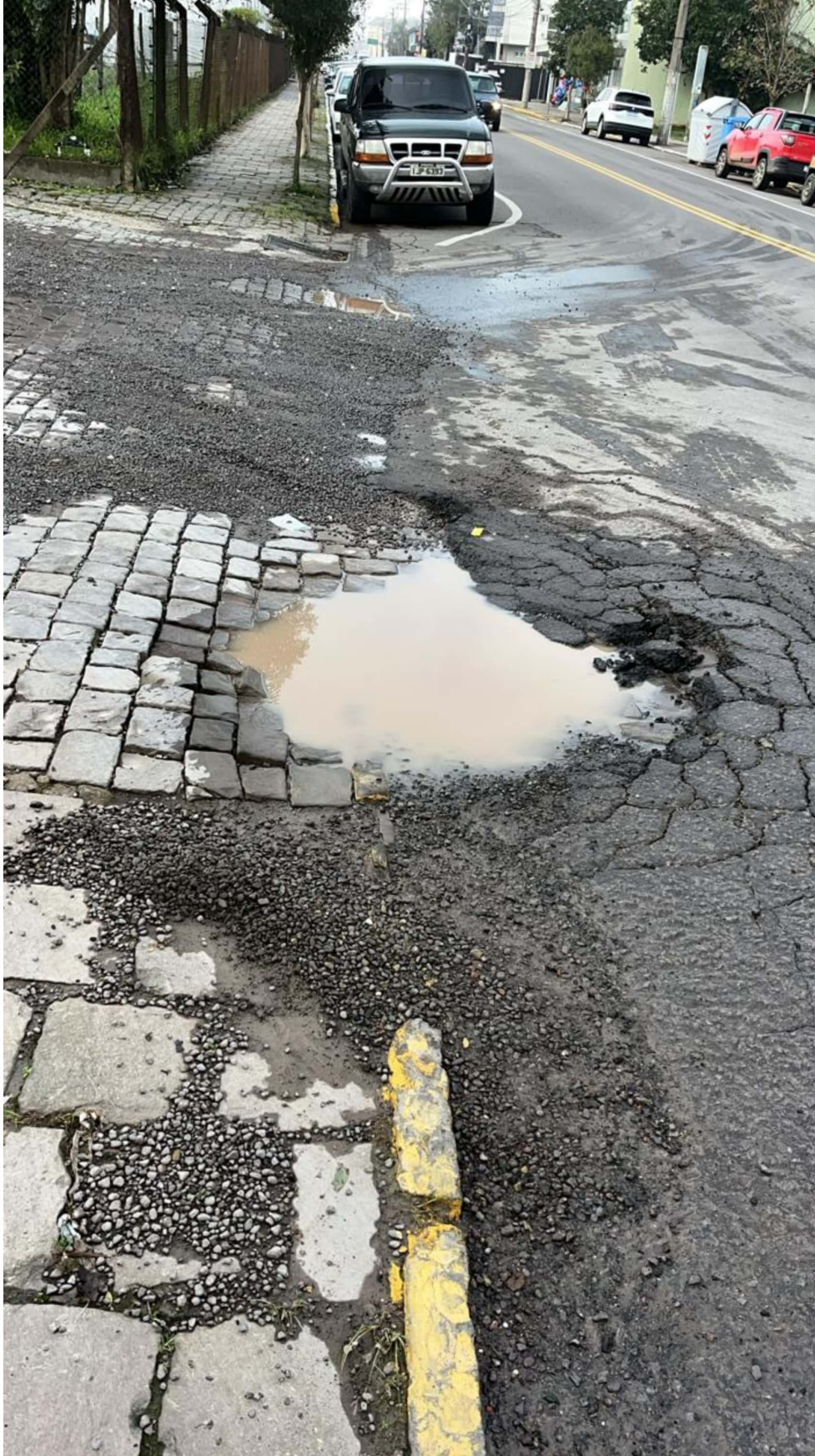
Digitalizado com CamScanner