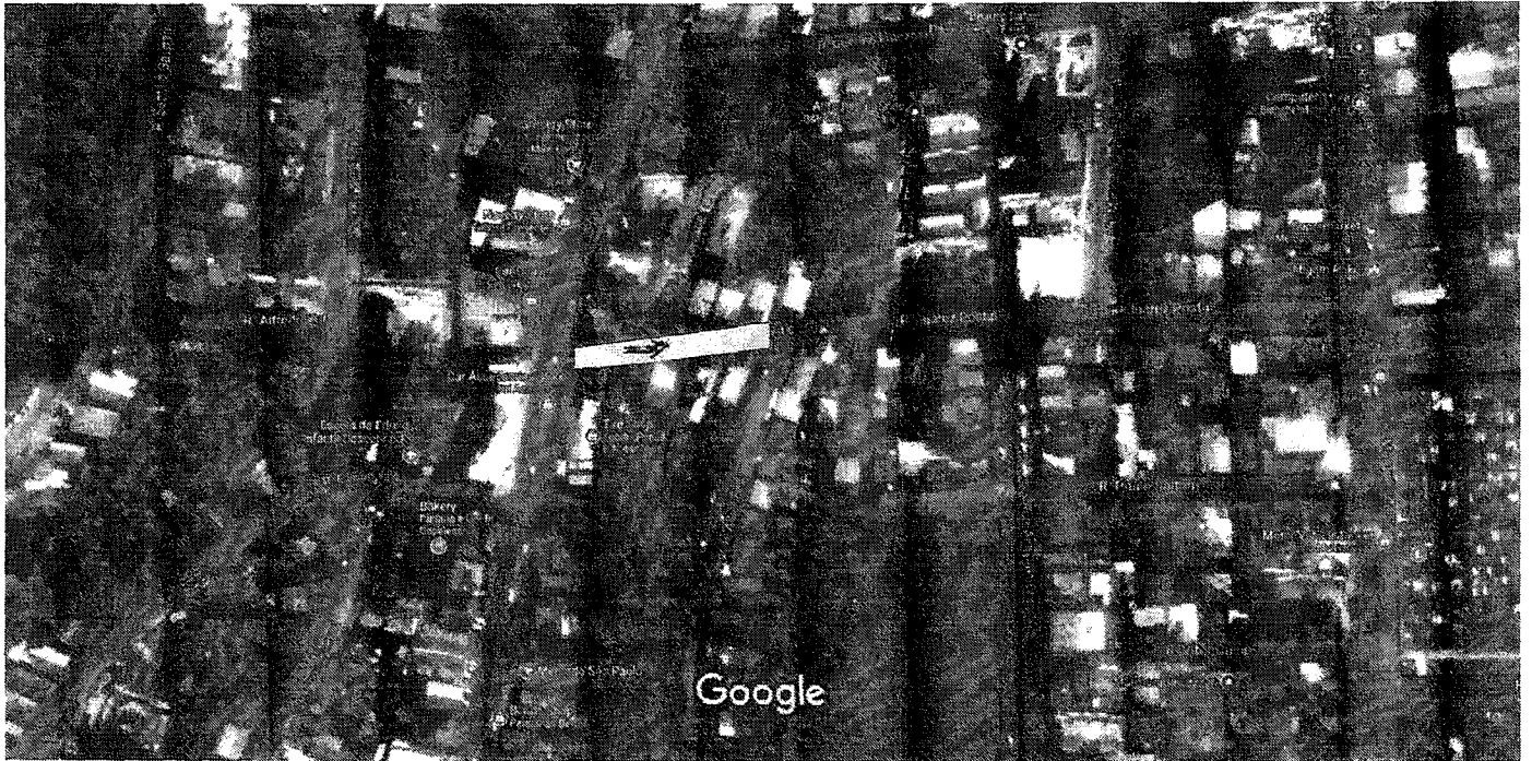
Brazil 20 m