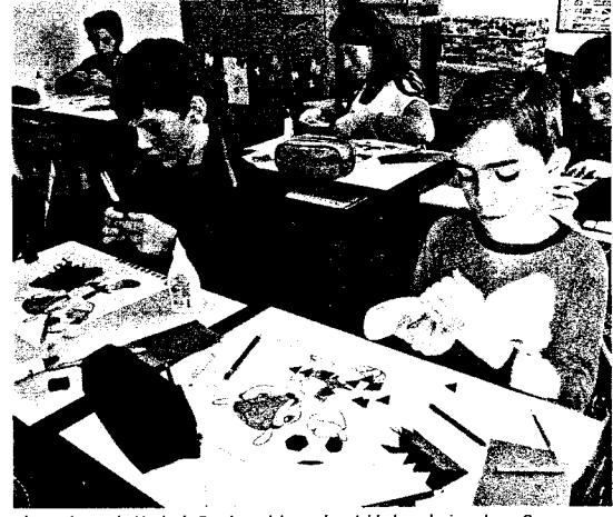
Alunos da escola Noely de Rossi participam de atividades relacionadas a Copa