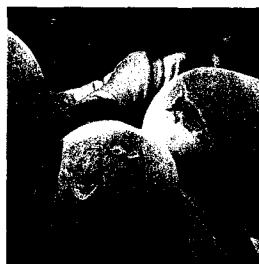
O relatório Secretarias da Agricultura e de Obras e Emater apontou 663 famílias atingidas na agricultura, em média a perda está estimada em 80% da produção

Para efetivar o decreto, o governo municipal criou a Coordenadoria Municipal de Defesa Civil. O órgão foi criado e estruturado em tempo recorde: cinco dias. Além do levantamento dos prejuízos, o órgão foi