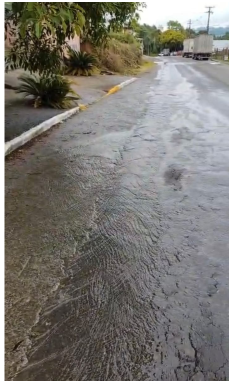
Rua Joaquim Toniollo, manutenção de boca de lobo.