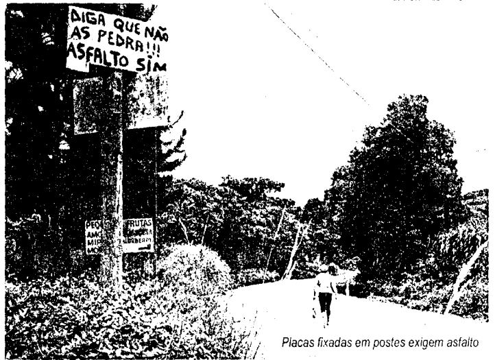
Placas fixadas em postes exigem asfalto

Em contrapartida, uma comissão formada por moradores da comunidade de Santo Antônio - trecho de estrada de chão que liga Bento a Farrouilha - decidiu que não aceitará a pavimentação basáltica. "Ou é tudo ou é nada", afirma com convicção um morador que não quer se identificar. "Faz mais de 20 anos que a gente luta por esse asfalto e agora querem nos empurrar o calçamento. Isso não aceitamos", diz.