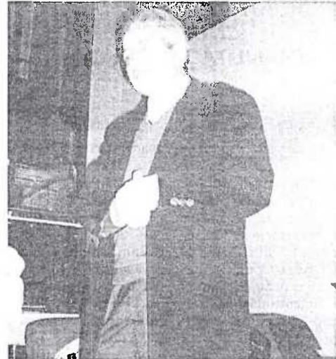
Pedrini explicou a importância da qualidade da mamografia

Conforme a carta, atualmente as pacientes encontram dificuldade de diagnóstico, causada pela demora no encaminhamento para a biópsia. Por isso, a brevidade nos casos que requeiram intervenção cirúrgica também está sendo reivindicada.